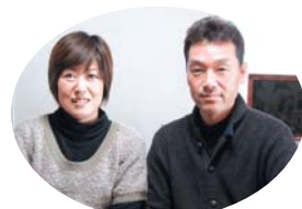
若々しいKさんご夫妻