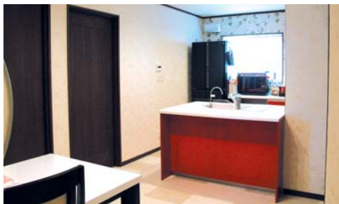
キッチンはヤマハ、バスはTOTOと、細部まで手抜きなしのセレクトです。