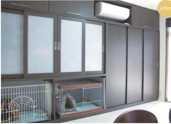
ペットのスペースもしっかり確保した自慢のオーダー家具