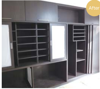
取納物のサイズに合わせた棚の図面はご主人の力作!

娘さんが心を動かし、それがきっかけで最終決断! 実は他社よりも見積もりは高かったとお二人は笑います。