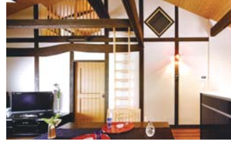
ロフトへのはしこ