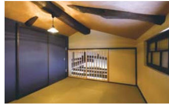
ロフトは心を開放する落ち着いた空間